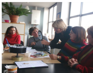
Rencontre au GRAC